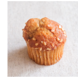
・キャラメルバナナ