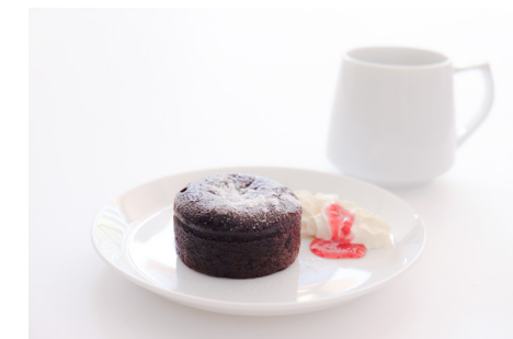
・フォンダンショコラ+コーヒーセット

雪室珈琲にぴったりのちょっとビターな大人ショコラ。 ストロベリーソースと生クリームを添えてみました。