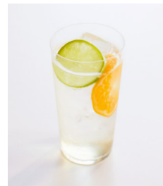
・自家製季節の フルーツビネガー