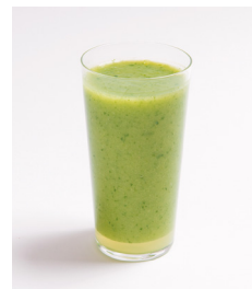
・洋梨&パイナップルと 小松菜のスムージー