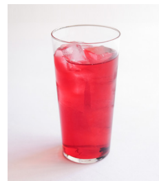
・クランベリージュース