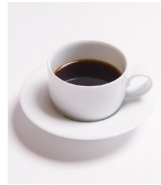
・雪室ブレンドコーヒー