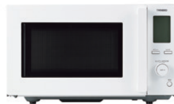
センサー付フラット電子レンジ〈DR-F281W〉

ストレスフリーなあなたの暮らしを支える「頼れる」電子レンジ。ユーザーの不満であった「あたためムラ」を解消する解凍上手な製品で、冷凍食品を手軽に美味しく。シンプル操作&1000Wの高出力。