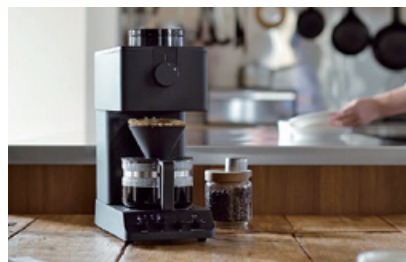
全自動コーヒーメーカー <CM-D457B>

プロのハンドドリップの正しい作法を再現する独自の機構やオンラインストアで地域企業のコーヒー器具をラインアップするなど、コミュニティ重視のものづくりが評価されました。