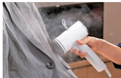
ハンディースチーマー <SA-D096W>

単機能にした事で様々な用途が生まれる「引き算」のデザイン。全体の構成バランスの中で決して使いやすさや機能を犠牲にしていない点と空間になじむデザインが評価されました。