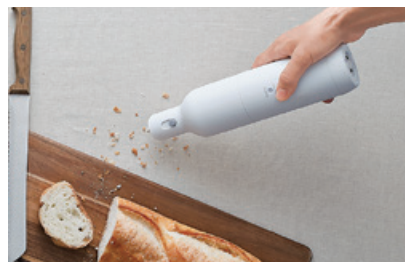
ボトル型クリーナー <HC-E205W>

プロのハンドドリップの正しい作法を再現する独自の機構やオンラインストアで地域企業のコーヒー器具をラインアップするなど、コミュニティ重視のものづくりが評価されました。